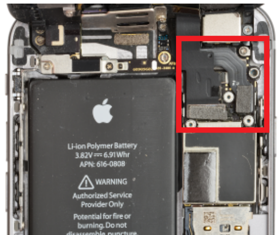
Beispielfoto iPhone 6